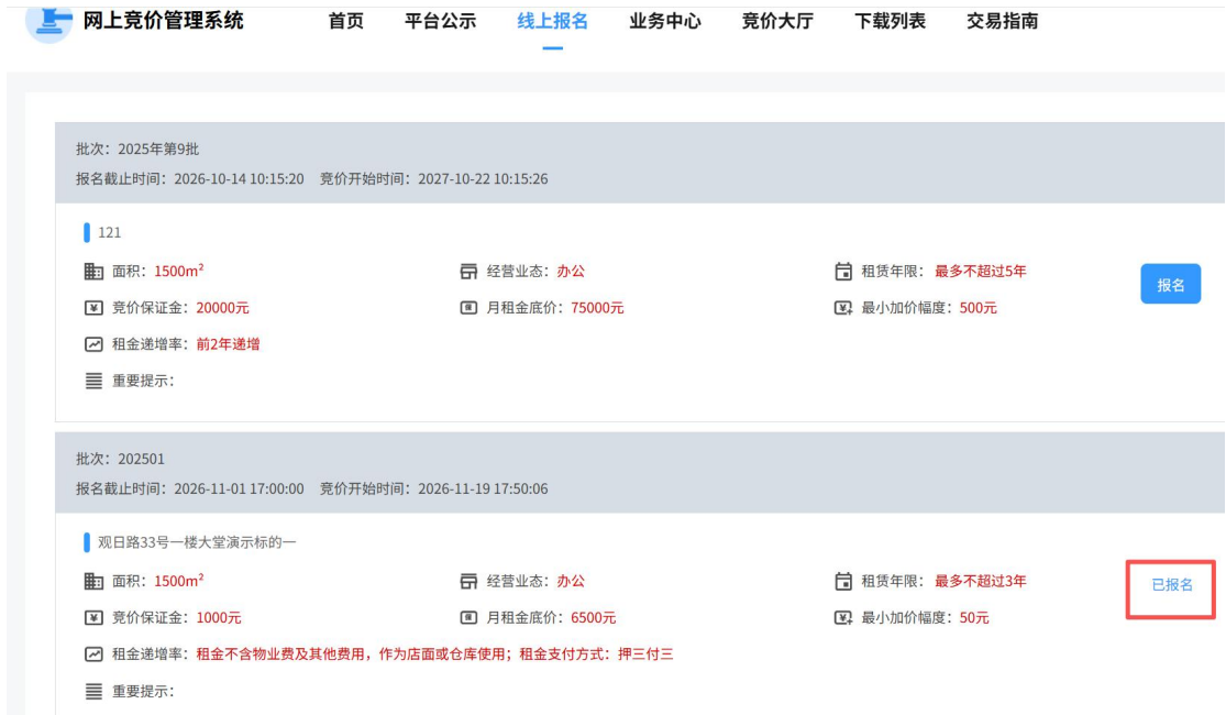
图 1.5- 4