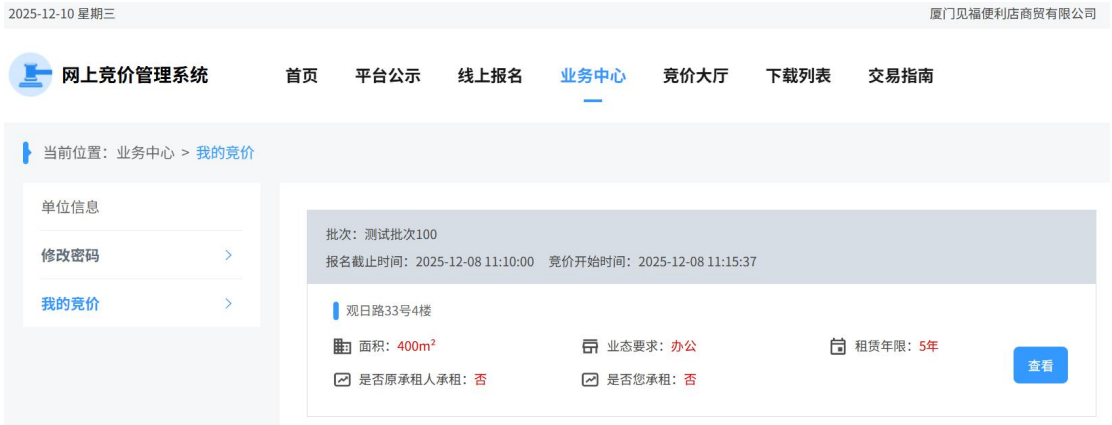
图 1.7- 1

用户登录系统后，点击【业务中心】菜单栏进入，页面显示报名标的是否中标等相关信息。如图 1.7-1 所示：